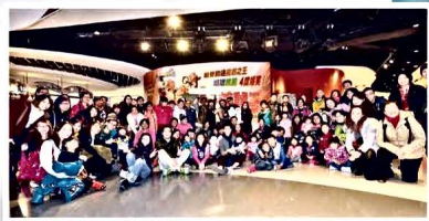
2月15日的國際天使綜合症日，對於天使綜合症患者，目前沒有特效的藥物，主要是對症治療。（圖為一眾天使病家庭於當日包場看電影）