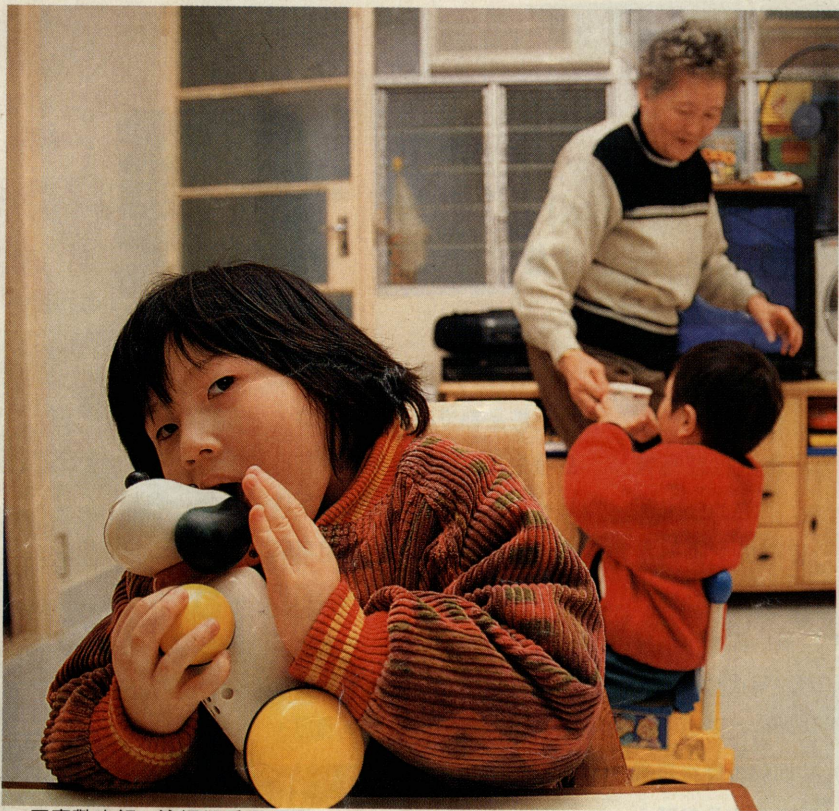
不喜歡吃飯，詠媚卻愛舔玩具。